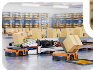
▼ 自律移動ロボット (AMR)